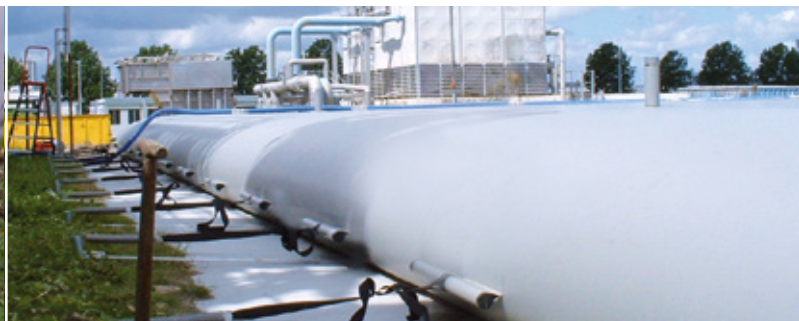
L'Alligator Bagtank est approprié aux applications industrielles.