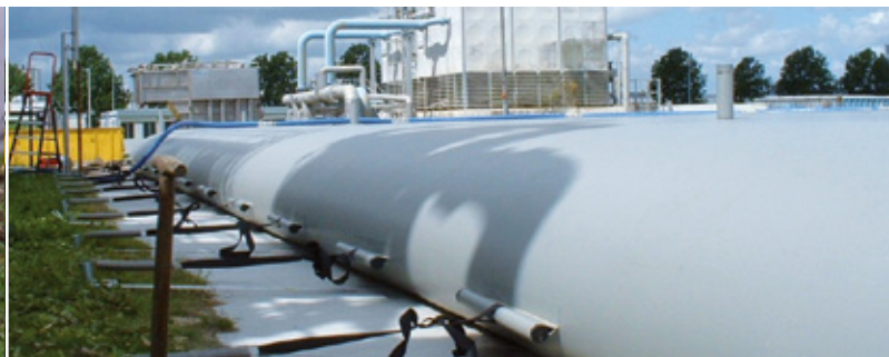
Alligator Bagtank è adatto alle applicazioni industriali.