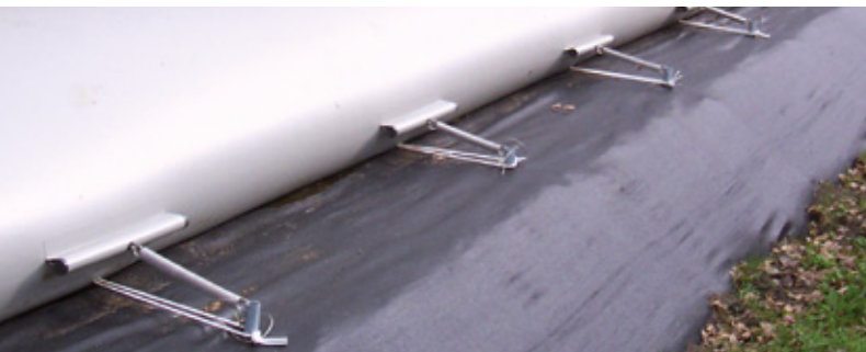
L'ancoraggio flessibile permette di ottenere una posizione corretta con qualunque livello del liquido.

Albers Alligator fornisce i propri prodotti a livello nazionale ed internazionale avvalendosi della collaborazione di rivenditori autorizzati in modo tale che ci sia sempre un esperto di riferimento al vostro fianco.