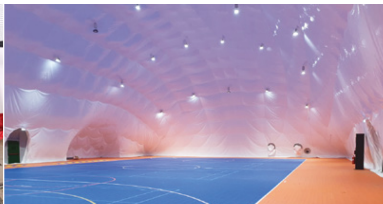
Luchthal Almere Poort