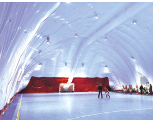
De WMHC hockeyhal in Wageningen. Door de draaideur (midden) is er geen drukverlies in de hal bij binnenkomst.

De mechanische krachten die tijdens het gebruik in de Luchthal optreden worden eenvoudig door het sterke weefsel opgenomen. Aan de hand van sterkteberekeningen zijn de belangrijkste componenten als materiaal, lasnaden en bevestigingspunten met zeer ruime veiligheidsmarges gedimensioneerd.